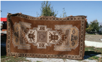
Foto 15- Yer (Taban) halısı, 196 x 218 cm, çözgü ve atkı siyah koyun yünü, Akyaka köyü muhtar evi (b. deniz, Mayıs 2017)