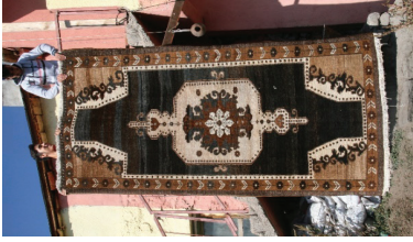
Foto 13- Seccade halısı, 167 x 305 cm, çözgü ve atkı pamuk, düğüm yün, 1970 yıllarına ait, Lütfi Yılmaz evi, Yalnızçam köyü (b. deniz, 2018)