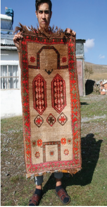
Foto. 9- Namazlık halısı, 65 x 115 cm, yün, Yalnızçam Fatma Şentürk dokuması, yaklaşık 50-60 yıllık (b. deniz, Ağustos 2018)