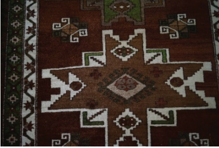
Foto 17- Yer (Taban) halısı, detay, Göle/Eski Demirkapı Köyü Camisi, 290 x 170 cm, 23.4.1986 tarihli dokuma, yün