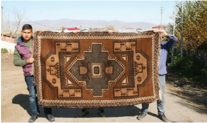
Foto 14- Yer (Taban) halısı, 164 x 200 cm, çözgü: kırçılı yün, Akyaka Köyü Camisi (b. deniz, 2017)