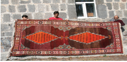
Foto 12- Seccade halısı, Yalnızçam Köyü Camisi, 165 x 383 cm, yün, Üzerinde "Cemal, 1912" yazısı var. (Ağustos, 2018)