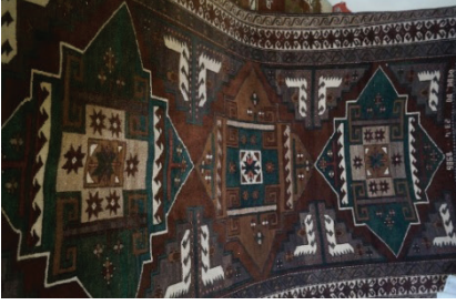
Foto 16- Yer (Taban) halısı, Göle/Eski Demirkapı Köyü Camisi, 290 x 170 cm, 23.4.1986 tarihli dokuma, atkı, çözgü: karakoyun yünü